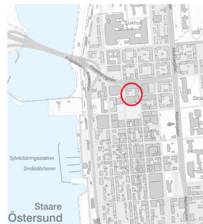
Översiktskarta över planområdet och de närmaste omgivningarna