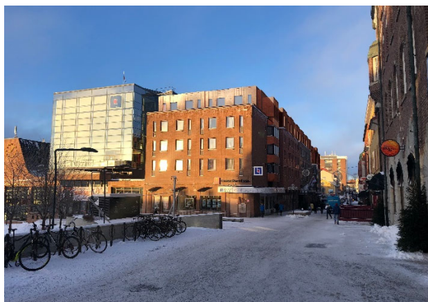
Visionsbild, Krook & Tjäder. Vy norrut från Stortorget längs Prästgatan.

Syftet är också att reglera den tillkommande bebyggelsens omfattning och utformning på ett sådant sätt att den blir lämplig i förhållande till kulturmiljön kring Stortorget, samt i förhållande till stadens anblick och siluett.