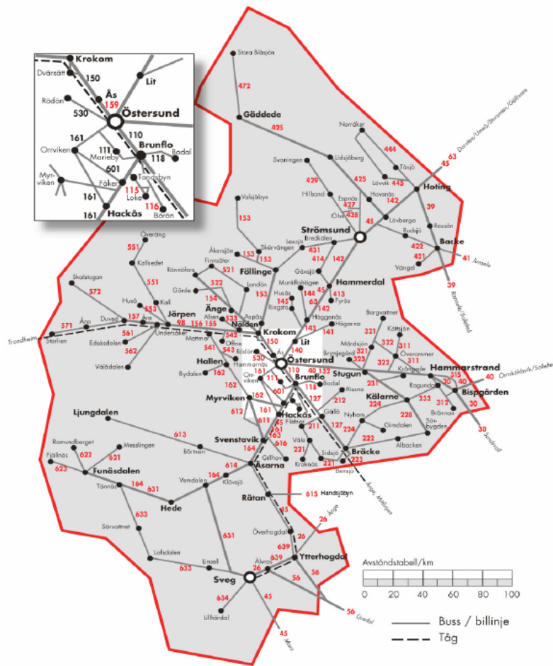
Figur 2 Linjenät i länet (exkl stadsbusstrafik i Östersund och Närtrafik)

I regionbusstrafiken sker en operatörsförändring i december 2019 då Trönderbilene tar över trafiken i sex av länets kommuner, utom Ragunda och Åre kommuner.