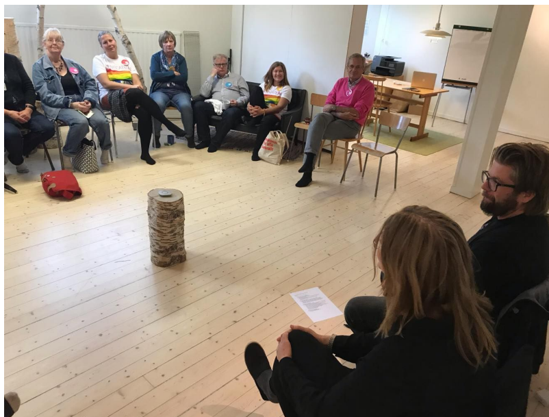
Bild från informationsmöte kring Elvira, Elvira med länets Riksteaterföreningar.

Föreningen har sedan aug 2018 drivit föreningsverksamheten från lokalen på Fjällgatan 29. Hösten 2019 övertar föreningen även kontraktet för lokalen. Lokalen ska användas för föreningens verksamhet, huvudsakligen som kontor och repetitionslokal. Lokalen kan även användas för våra offentliga föreställningar.