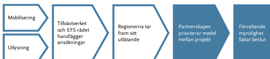
Figur 3 Steg i processen att bevilja EU-medel

I det här kapitlet beskriver vi och redovisar våra iakttagelser om hur partnerskapen bedriver arbetet med att prioritera medel mellan projekt, och hur det påverkar Tillväxtverkets och ESF-rådets beslut.