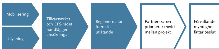
Figur 2 Steg i processen att bevilja EU-medel

I det här kapitlet beskriver och redovisar vi våra iakttagelser om hur Tillväxtverket, ESF-rådet, partnerskapen och regionerna i de olika partnerskapsområdena hanterar dessa inledande steg i processen: mobilisering, utlysning, myndigheternas handläggning och regionernas framtagande av sitt utlåtande.