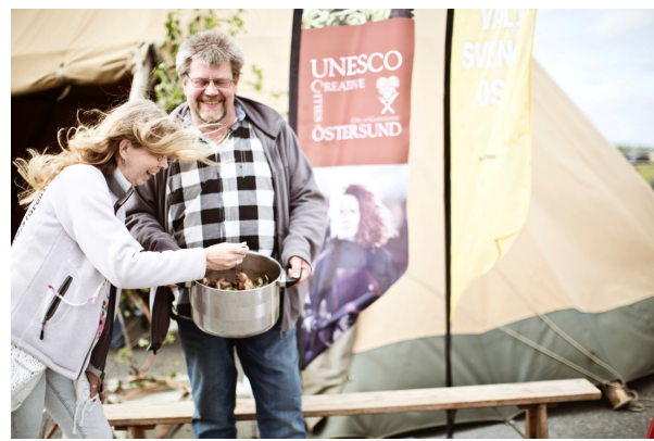
© Tina Stafrén – UN Sustainable Gastronomy Day – creative pARTy 2017