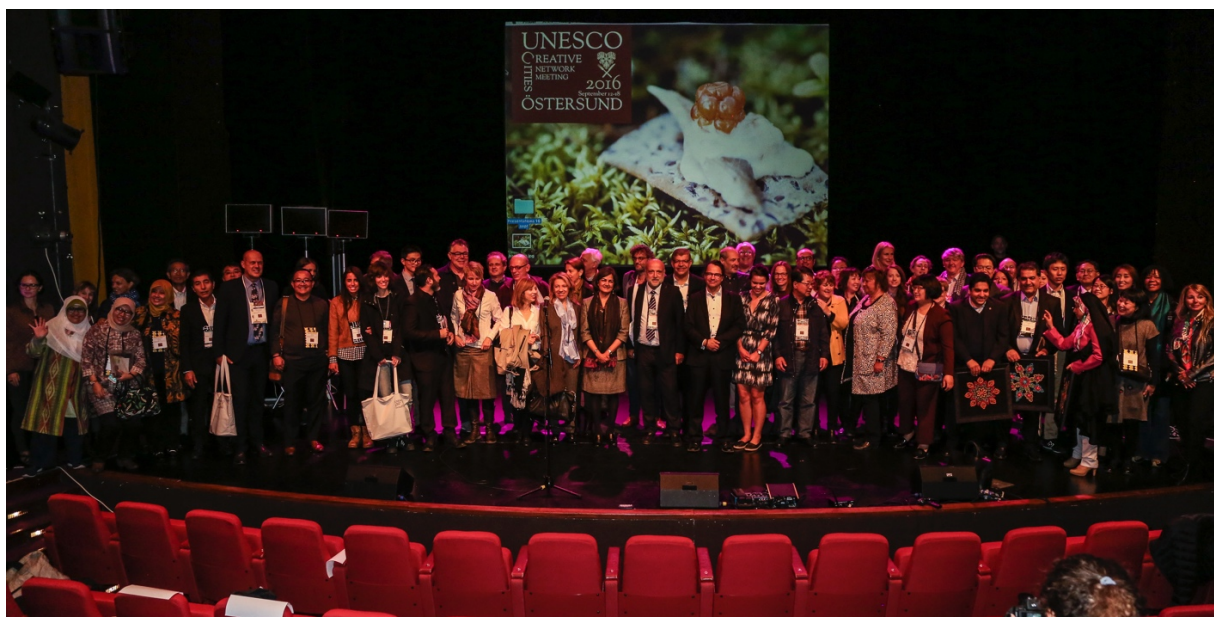
UCCN2016 Östersund 15 september 2016

I arbetet med att positionera Östersund och Jämtland Härjedalen i globala värdekedjor, kommer UNESCO Creative Cities Network framgent att användas som ett verktyg för affärskontakter och kompetensöverföring mellan regionala företag/entreprenörer i den kreativa och kulturella sektorn och företag på en internationell marknad. Arbetet kommer också att samverka med utvecklingsarbetet i Team Sweden, regeringens operativa initiativ för att öka internationalisering och export från Sverige, där KKN är ett av Sveriges sex prioriterade exportområden.