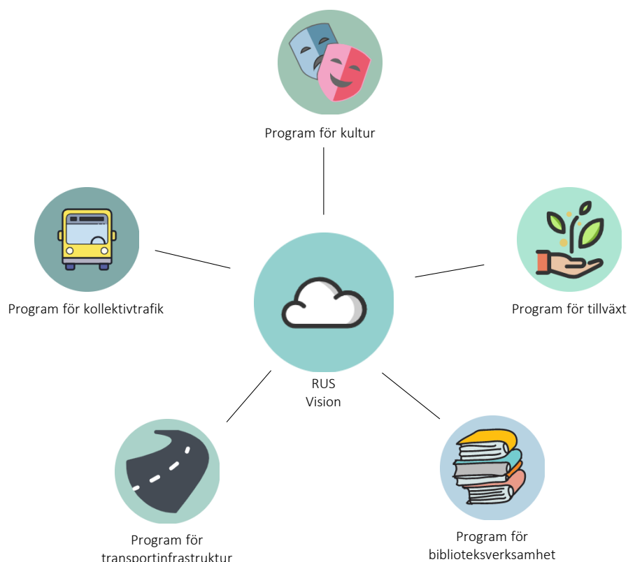
Bild 1: Beskrivning av hur den övergripande omställningen påverkar den Regionala utvecklingsstrategin och kopplingen till Region Jämtland Härjedalens uppdrag inom regional utveckling.

Region Jämtland Härjedalens regionala utvecklingsnämnd ansvarar för politikområdena: regional biblioteksverksamhet, regional kulturverksamhet, kollektivtrafik och det regionala utvecklingsansvaret som kommer i två delar transportpolitik och tillväxtarbete.