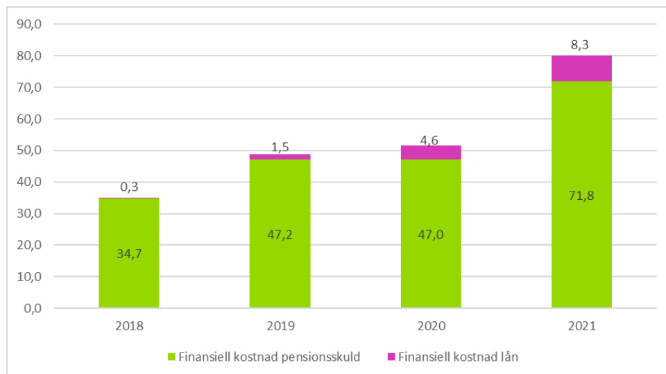
Figur 2. Prognos finansiella kostnader 2018–2021 Region Jämtland Härjedalen