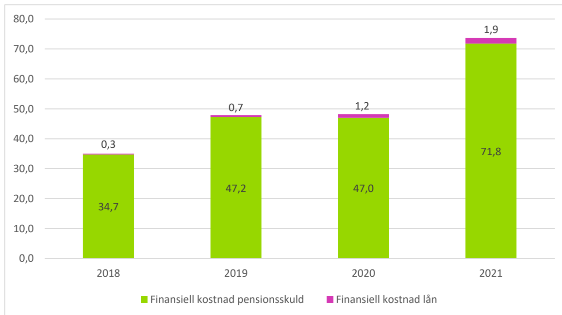
Figur 2. Prognos finansiella kostnader 2018–2021 Region Jämtland Härjedalen

stigande marknadsräntor infrias, kommer de finansiella kostnaderna att stiga kraftigt under planperioden.