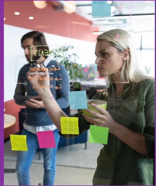
Utveckling och digitalisering