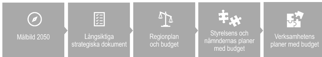
Figur 1. Styrkedja.

Regionplan och budget är det styrdokument som utgör grunden för verksamheternas årliga planering och budgetarbete. Regionplanen tydliggör planperiodens politiska viljeinriktning för respektive målområde, med fokus på vad som ska prioriteras och utvecklas. De politiska prioriteringarna och budget på övergripande nivå för respektive målområde ska ha en tydlig förankring i verksamhetens förutsättningar och behov. Regionfullmäktige kan i regionplanen för respektive målområde lägga till långsiktiga nyckeltal samt vid behov ge uppdrag för kommande år till styrelsen och nämnderna.