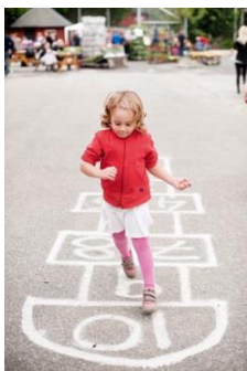
Bild: Vår arbetsmiljö påverkar hur vi mår och hur vi presterar.

Det gäller naturligtvis också för våra barns skolmiljö. Folkhälsa inom det här området handlar om att skapa bästa möjliga förutsättningar för att ta till sig