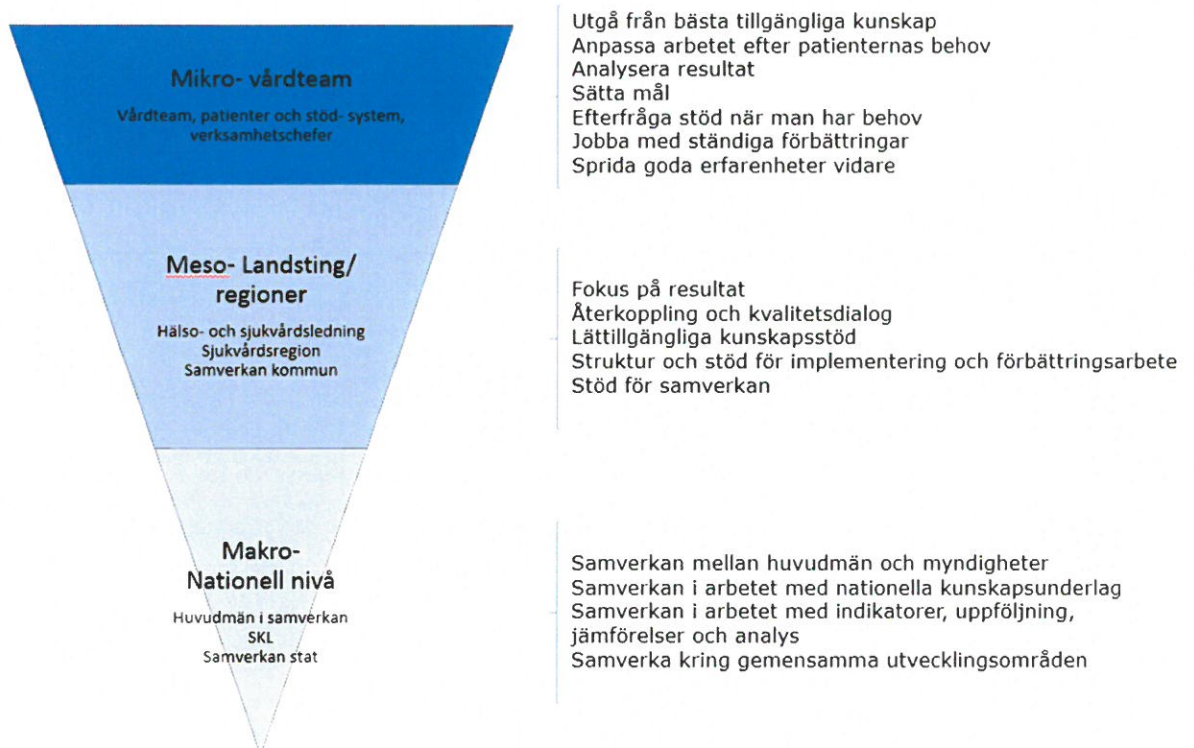
Figur 1. Samspel i en ökad kunskapsstyrning.

Utgångspunkten är att bästa möjliga kunskap ska finnas tillgänglig vid varje möte mellan vårdpersonal och patient. Det ska vara lätt att göra rätt och det ska finnas förutsättningar för lärande. Kunskapsstyrning omfattar de samverkande delarna kunskapsstöd, stöd för uppföljning, Öppna jämförelser och analys samt stöd till utveckling . Vägledande för det som ska göras nationellt gemensamt är att det kompletterar och stödjer det som behöver göras på regional och lokal nivå.