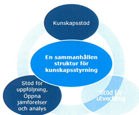
Figur 2. En sammanhållen struktur för kunskapsstyrning i samverkan.

Etableringen av en sammanhållen struktur för kunskapsstyrning innebär att landstingen gemensamt identifierat och långsiktigt säkerställer finansiering för de verksamheter och funktioner man vill samverka kring och samordna med stöd av SKL. I första hand gäller samverkan de samspelande delarna kunskapsstöd och stöd till uppföljning, Öppna jämförelser och analys .