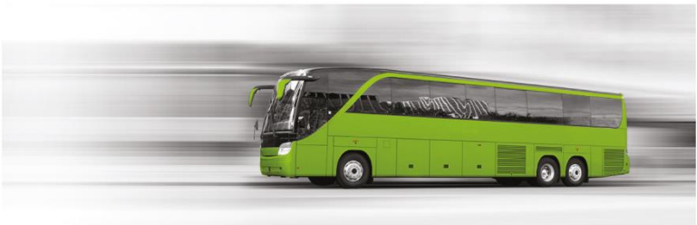
FOTON ILLUSTRATIONER: SARA RÖNNBERG, ANNE EILÉN, SKANDINAV EILÉN, SARA LEE